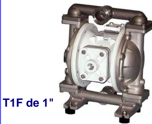
T1F de 1"

LIDER NACIONAL DE BOMBAS NEUMÁTICAS DESDE 1985 BOMBAS SANDPIPER (WARREN RUPP) DESDE 1965