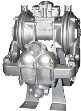
Heavy Duty Ball

LIDER NACIONAL DE BOMBAS NEUMÁTICAS DESDE 1985 BOMBAS SANDPIPER (WARREN RUPP) DESDE 1965